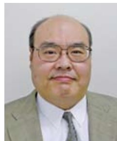
一般社団法人山口県柔道協会 会長