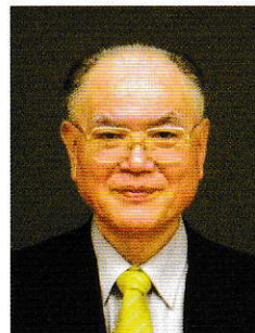
一般社団法人山口県柔道協会 会長